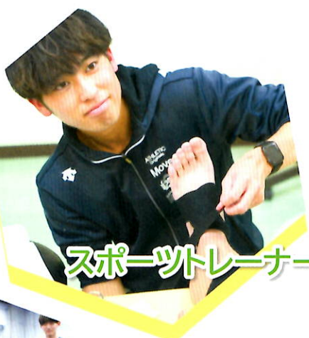
スポーツトレーナー